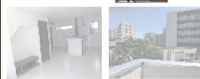
自然光が入ると明るいLDK (大窓のワイドな視界)

同地区播磨町三丁目/番49号/新築戸建「西田辺」駅徒歩8分/土地面積:20.25㎡/延床面積:110.52㎡ 2階建中高層住宅専用用途/築:全1階/60%/容積率:107%/木造2階建/平成29年4月築/現況:空室/引渡:即時/仲介